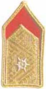
parancsnok vagy egyesületi elnök ( pk. akkor, ha tú.pk-i, tiszti vagy technikai tanfolyammal)