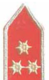
rajparancsnok vagy szerkezelő (érettségivel és alapszintű tűzoltó tanfolyammal)