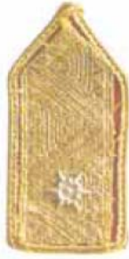
MTSZ országos alelnök vagy országos titkár/irodavezető MTSZ országos bizottsági elnök