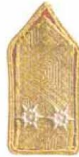
MTSZ országos elnök