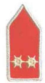
híradó ügyeletes, gépkocsivezető, vagy beosztott tűzoltó (alapszintű tűzoltó tanfolyammal)