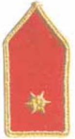
rajparancsnok vagy egyesületi titkár, gazdasági v. műszaki felelős ( rajpk. akkor, ha tú.pk-i, tiszti vagy technikai tanfolyammal)