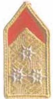
MTSZ megyei elnök MTSZ országos tagozat elnök