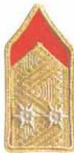
MTSZ megyei alelnök vagy megyei titkár