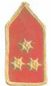
parancsnok vagy egyesületi elnök ( pk. akkor, ha tú.pk-i, tiszti vagy technikai tanfolyammal)