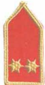
parancsnok - helyettes alelnök, elnökhelyettes ( pkh. akkor, ha tú.pk-i, tiszti vagy technikai tanfolyammal)